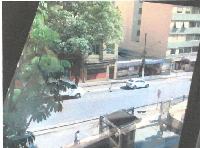
Figura 01 – janela 1º ao 4 andar

3.6. A Contratada deverá fornecer manual de limpeza das faces em vidro após instalação da película. Este manual deverá ser claro e de simples entendimento. Neste manual deverá estar descrito as ferramentas e materiais que podem ser utilizados na limpeza bem como demais orientações técnicas.