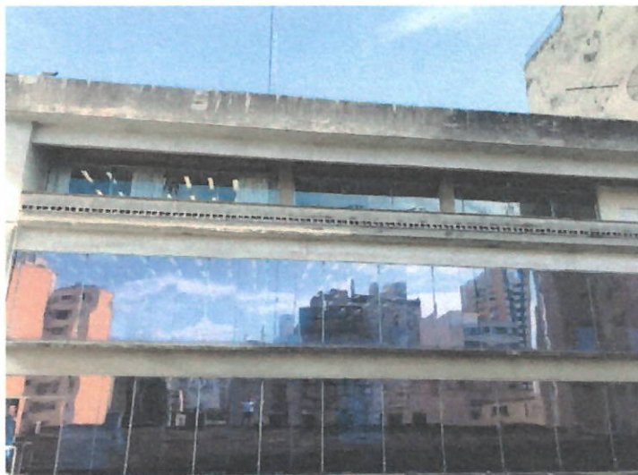
Figura 03 – Fundos