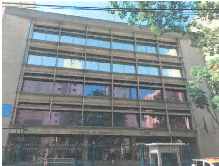
Figura 02 – Frente

7.2. Para conhecimento e o correto dimensionamento da proposta, as figuras 02 e 03 apresentam as características das faces em vidro.