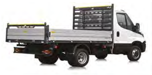
Carroceria metálica, malha e batente